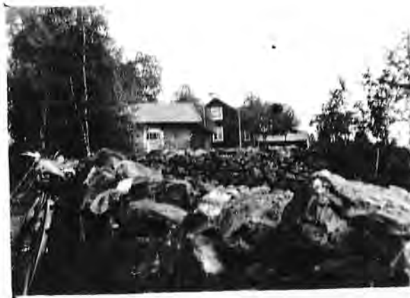
Stora stenrösen är monument över det arbete som gjorts för att få till åkermark för odlingar.