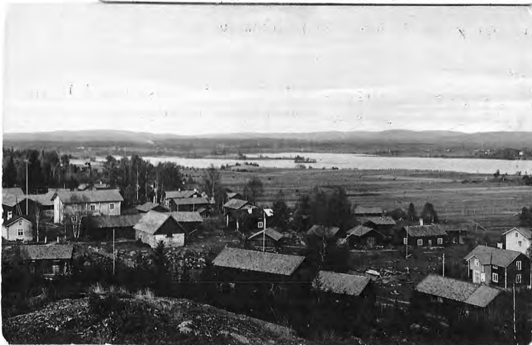
KLACKGÅRDARNA i början av 1900-talet