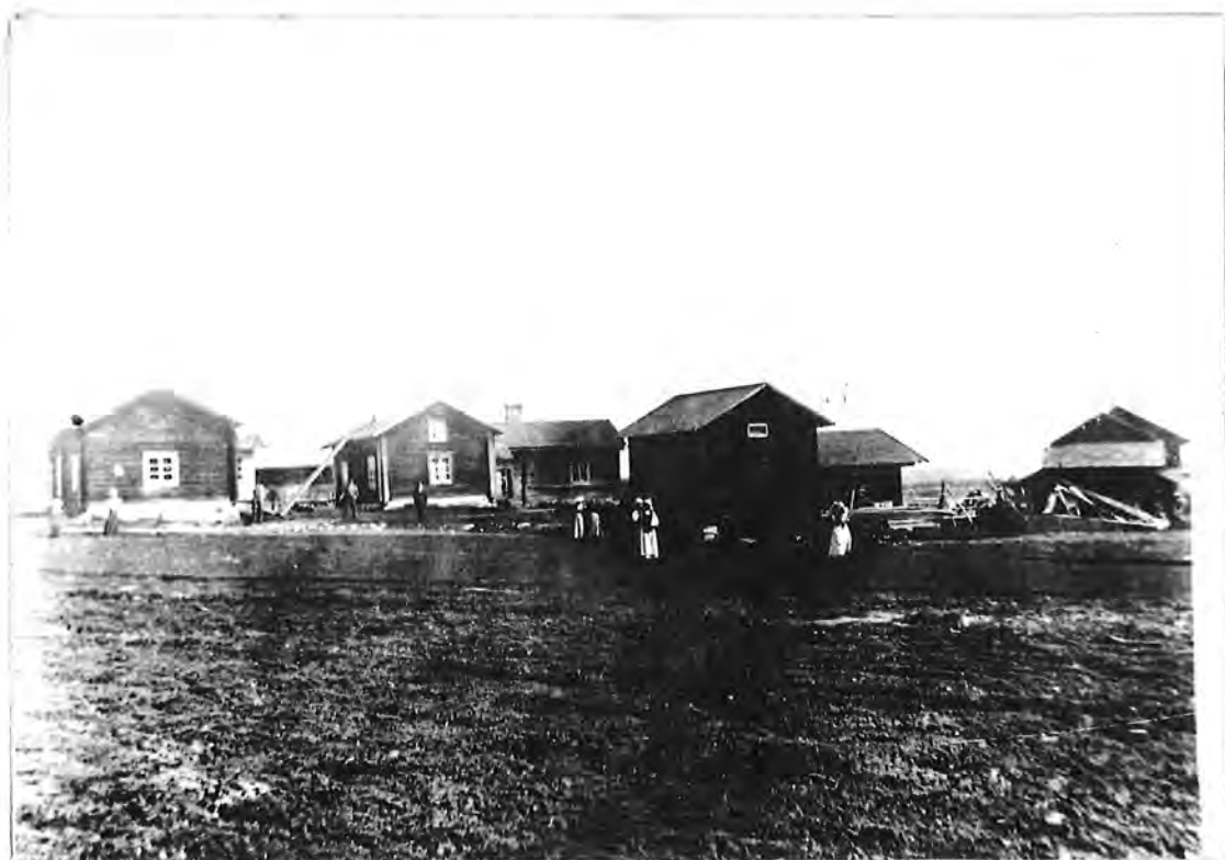
HYTTSVEDSÖRDARNA i början av 1900.