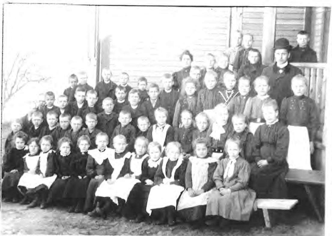
ELEVER I VÄSTANSJÖ SKOLA C:A 1907.