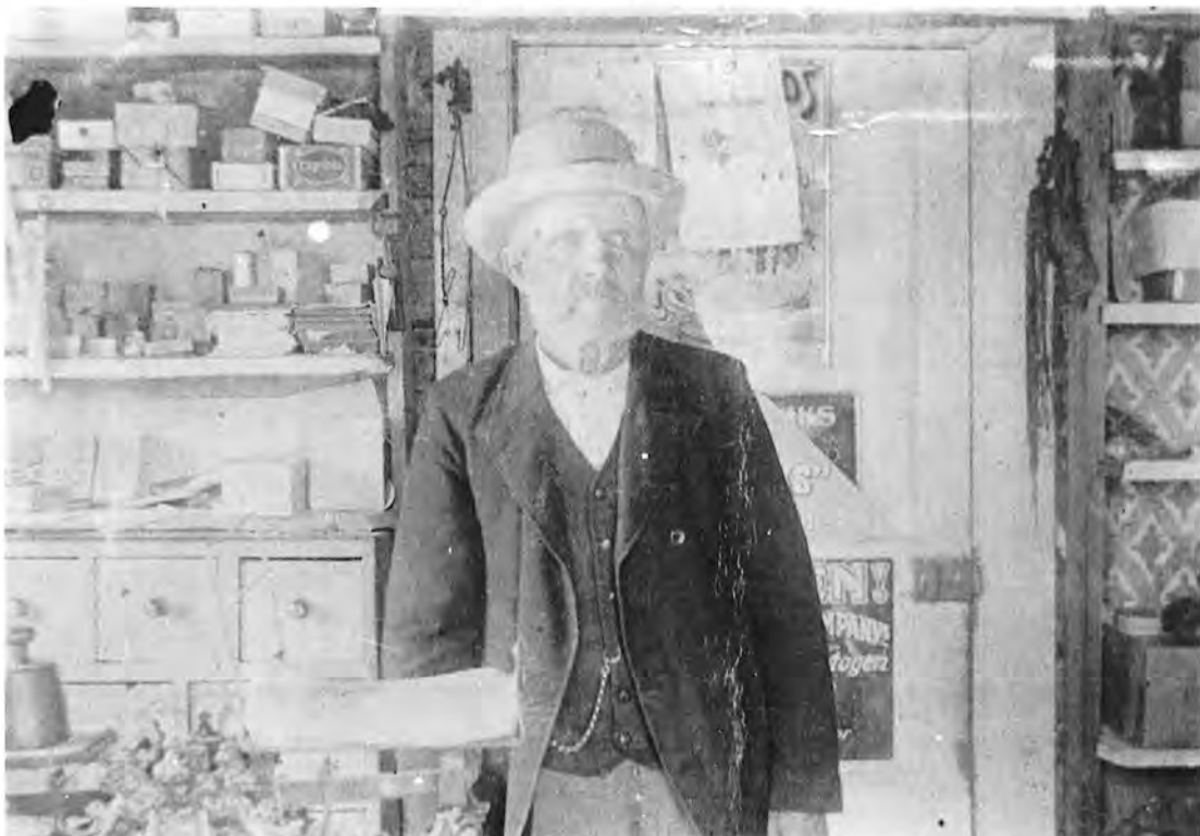
"KOJ PELLE" I SIN HANDEL PÅ KOJFALLET.