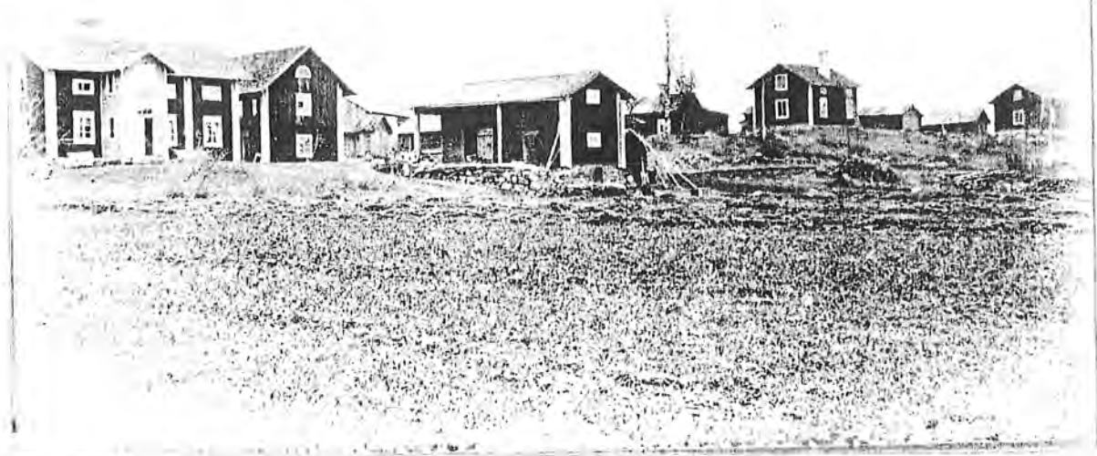
GÅRDARNA VID UVBERGET I BÖRJAN AV 1900-TALET.