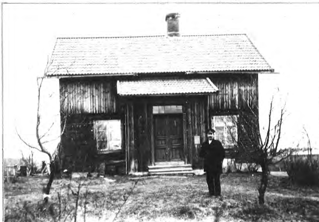
PETTER BACKLUND KNUTBACKEN GJORDE MYCKET:

Postijon handlare skräddare dragspelare m. m.