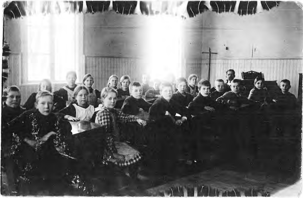
ELEVER I STORSKOLAN VÄSTANSJÖ 1919.