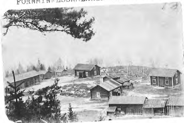
Parti av Uvberget i början av 1900-talet

(Granlund försvann efter det mycket omskrivna Uvbergsmordet 1913 och återfanns aldrig.)