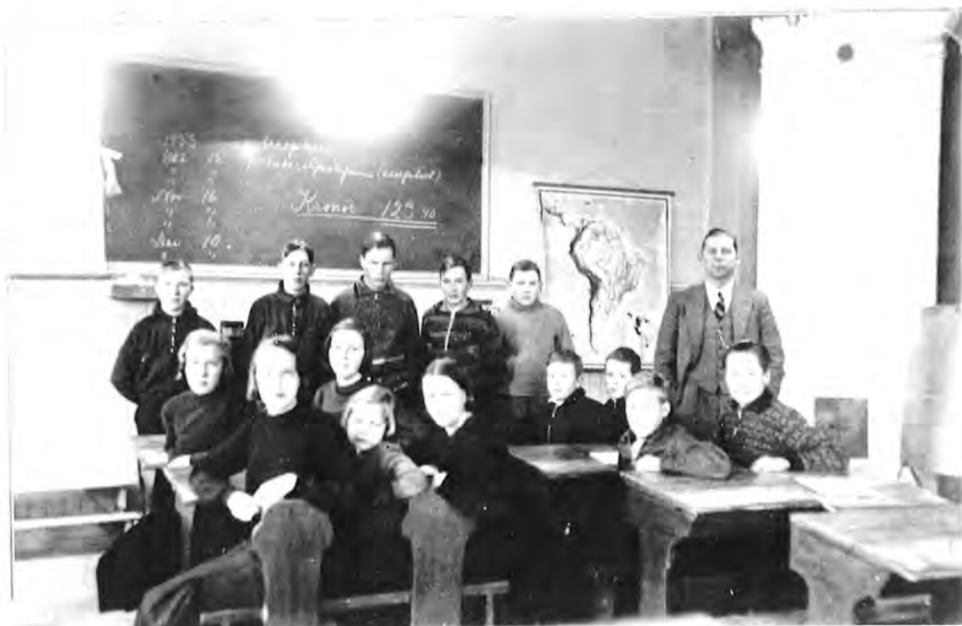
I VÄSTANSJÖ SKOLA I BÖRJAN AV 30-talet