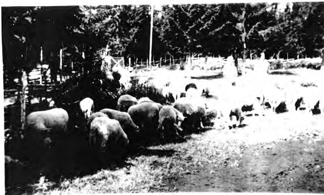
Fåren skulle skiljas åt, då de på höstsidan togs hem, från sommarens frigång på skogen.