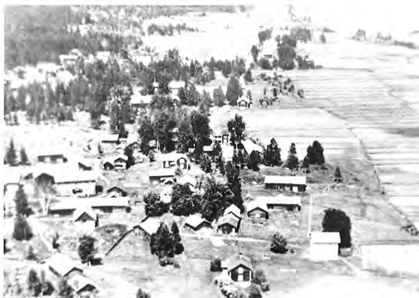
KLACKGÅRDARNA På 1920-talet